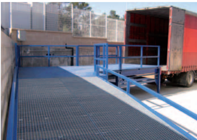
Rampa fija curvada con bancada y rampa Hidra.

1. Tope de carga y cadena de enganche; 2. Bomba manual; 3. Accionamiento; 4. Rampa de acceso y soporte de transporte; 5. Rejilla antideslizante galvanizada; 6. Pies de apoyo y seguridad (posición reposo); 7. Ruedas de transporte.