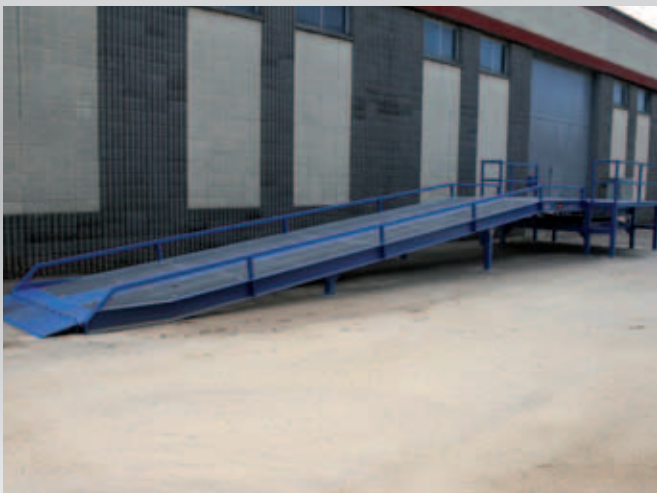
Rampa móvil para carga y descarga en trenes.