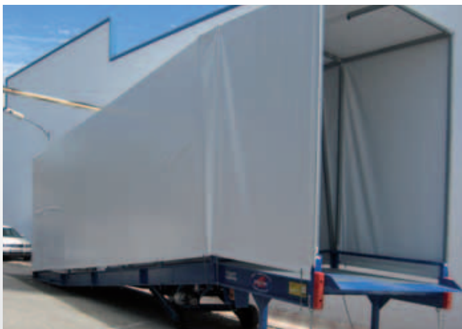
Rampa móvil con cubierta de PVC.